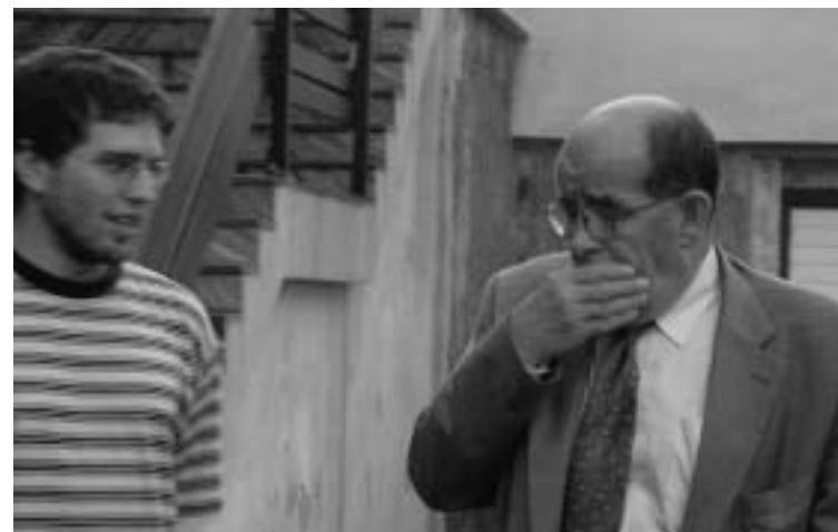
Čestný host – první český ombudsman JUDr. Otakar Motejl.