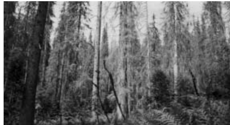
Trojmezský prales – 1. zóna NP Šumava.

Stejně jako v předchozích letech „zasahovala“ Správa Národního parku Šumava proti kůrovci. O povolení požádala Správu Národního parku Šumava. Správa národního parku žádost prošetřila (na ústním jednání před zástupci EPS a Hnutí DUHA zástupci Správy prohlásili, že zjišťování toho,