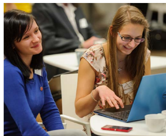
Na setkání s aktivními občany se budeš moci zdokonalit v organizačních dovednostech a potkat se s těmi, kterým spolu s Frankem Boldem pomáháš