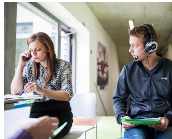
Intenzivní dvoudenní vstupní školení tě připraví na množství situací, které nastávají při komunikaci s klientem