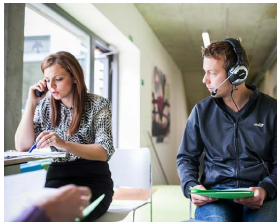
Intenzivní dvoudenní vstupní školení tě připraví na množství situací, které nastávají při komunikaci s klientem