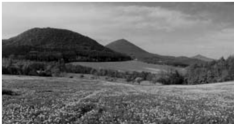
Tudy se automobilisté budou za jízdy kochat krásami Českého Středohoří.

V loňském roce vydal ministr životního prostředí nezákonně konečný souhlas s vedením dálnice unikátní chráněnou oblastí a podpořil tak variantu navrhovanou společností Ředitelství silnic a dálnic ČR, která úplně ignoruje jakékoliv zájmy ochrany životního prostředí v tak cenné lokalitě. Zamítnutí našich odvolání proti udělení výjimky ze zákona, který stavbu dálnic v chráněných