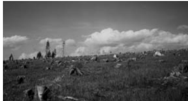
Modrava – 2. zóna NP Šumava.