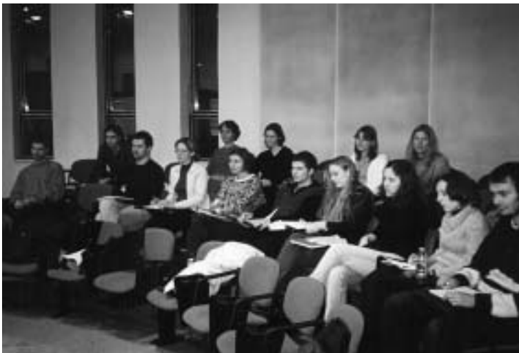
Pokračování ŠLP na PF olomoucké univerzity.