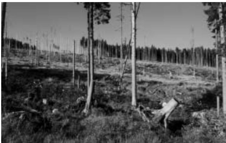
NP Šumava po zásahu „kůrovců“.

Poslanecká sněmovna nakonec návrh zákona ve druhém čtení zamítla – dobrá zpráva pro ty, kdož se obávali, že poslanci budou opětovně chtít v souvislosti s novou zákonnou úpravou zmenšit rozlohu tohoto chráněného území. Potěšující je také proto, že návrh zákona počítal v projednávání podobě s příliš vágními formulacemi pro náhrady za újmy spojené s existencí národního parku. Zamítnutí zákona lze naopak chápat jako promarněnou šanci pro velmi potřebné oddělení hospodaření v lesích od státní správy v parku. Také příležitost pro zásadnější rekonstrukci Rady národního parku směrem k její větší nezávislosti se nemusí jen tak opakovat.