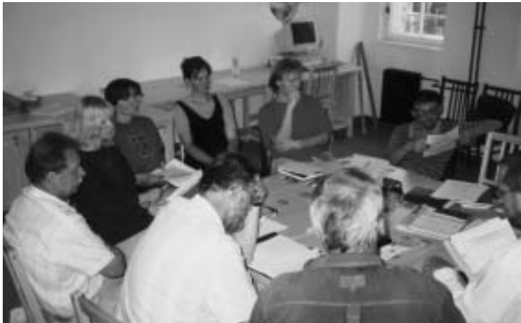
Schůzka členů BDK.

Problém mobilizoval (vedle množství místních nevládních organizací) také jednotlivé občany. Ti se začali nezávisle na sobě obracet na naši organizaci. Vznikla tak potřeba koordinovat práci tohoto nesourodného celku, zejména kvůli efektivitě práce a poskytování právní pomoci ze strany EPS. Proto jsme iniciovali zformování volného sdružení Brněnský dopravní kruh a po dobu jednoho roku jsme jeho činnost koordinovali. Dopravní kruh plní hlavně koordinační