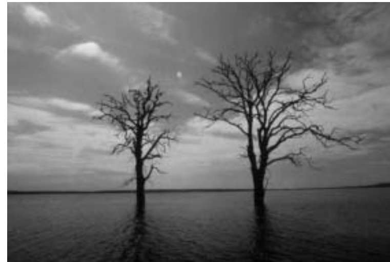
Lužní les pod Pálavou po zatopení.

Účastnili jsme se všech povolovacích řízení, podali jsme desítky právních podání, žalobu k Vrchnímu soudu v Praze, k případu jsme přitáhli pozornost médií. Hlavním problémem celého případu je, že se jedná o zástupný spor o kompetence (a moc) mezi ministerstvem životního prostředí a ministerstvem zemědělství. Podle zákona (a pozdějšího výkladu Ústavního soudu) spadá věc pod pravomoc ministerstva životního prostředí. S tím se ale extrémně silný zemědělský resort nehodlal smířit. Případ se tak změnil ve válku mezi úřady, jakou si dovedeme představit spíše v Středoafričské republice než v zemi vstupující do Evropské unie. Jeden úřad zvýšení hladiny