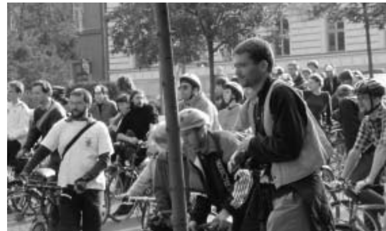
Občanské právní hlídky na Dni bez aut v Brně.

v uzavřených prostorech a neexistence nezávislé kontroly činnosti policie byla snaha informovat renomované zahraniční organizace a instituce zaměřené na ochranu lidských práv . Tato snaha se promítla do zpráv a doporučení, které tyto organizace vydaly.