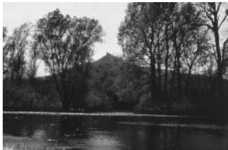
Lužní les pod Pálavou před zatopením.

Soustředíme se především na celostátní kauzy a na venkovské oblasti (pražské kauzy prakticky neřešíme). Naše práce se vždy opírá o důkladnou právní analýzu a z ní vycházející právní kroky. Pro zvýšení důrazu právní argumentace však necháváme zpracovávat i odborné expertízy, nevyhýbáme se medializaci či pomoci občanům při zakládání občanských sdružení.