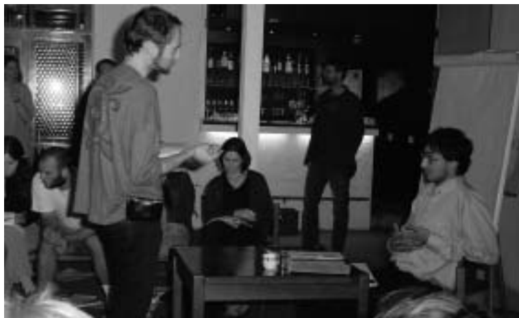
Simulované jednání na stavebním úřadě.

Škola lidských práv probíhala od nedělního podvečera 16. září do sobotního rána 22. září, a to v hotelu Koží Horka v lokalitě brněnské přehrady . V prostorách hotelu jsme byli ubytováni, stravovali jsme se zde a probíhal v nich také program. K účasti se mohli přihlásit studenti všech