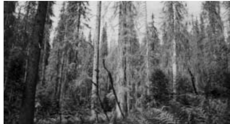
Trojmezský prales – 1. zóna NP Šumava.

Stejně jako v předchozích letech „zasahovala“ Správa Národního parku Šumava proti kůrovci. O povolení požádala Správu Národního parku Šumava. Správa národního parku žádost prošetřila (na ústním jednání před zástupci EPS a Hnutí DUHA zástupci Správy prohlásili, že zjišťování toho,