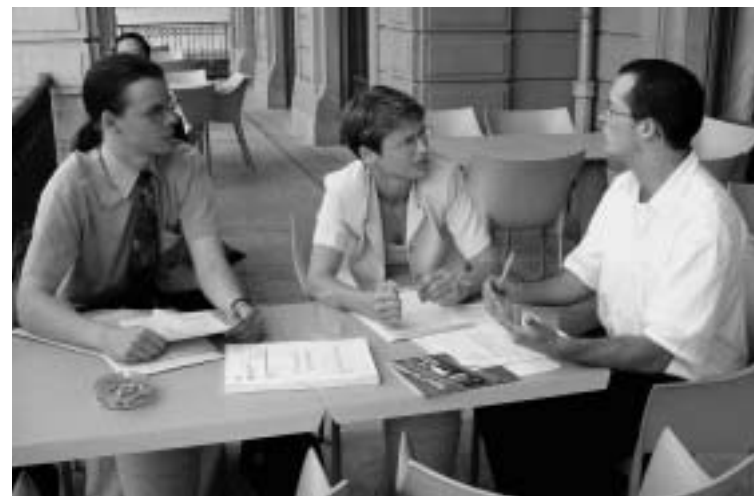
Jednání s asistentem Zvláštního zpravodaje OSN pro otázky mučení.

Mezinárodní federace lidských práv má poradní status při OSN, UNESCO a Radě Evropy. Její stálý ženevský delegát nám zprostředkoval setkání nejen přímo s experty Výboru pro lidská práva