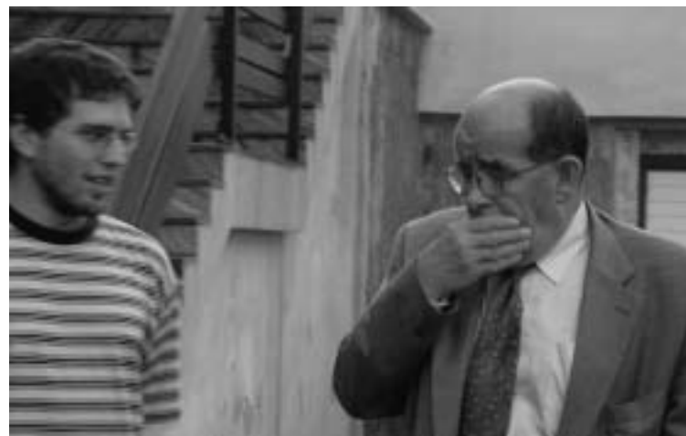
Čestný host – první český ombudsman JUDr. Otakar Motejl.