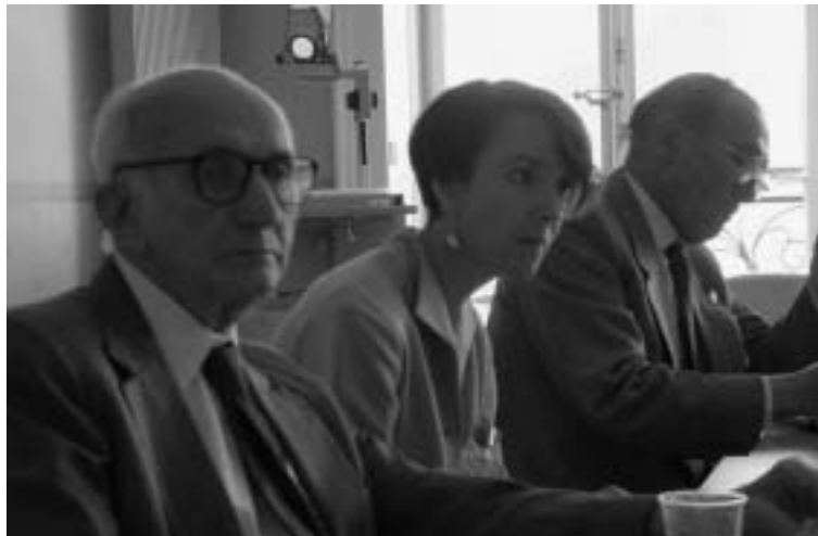
Členové Výboru OSN pro lidská práva při prezentaci zpráv OPH, OMCT a FIDH.

Výsledkem naší mise bylo, že ve shrnujících připomínkách Výboru pro lidská práva byl zahrnut požadavek (bod 16 doporučení) na zřízení nezávislého orgánu pro vyšetřování všech stížností týkajících se zneužití pravomocí policistů . Výbor výslovně uvedl, že „ současný systém je neobjektivní a nedůvěryhodný, a jak se zdá, zajišťuje beztrestnost policistům, kteří se dopouštějí