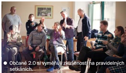
● Občané 2.0 si vyměňují zkušenosti na pravidelných setkáních.

V uplynulém roce se na mnoha místech České republiky občané chopili iniciativy a zapojili se do dění kolem sebe. A navzdory všeobecné skepsi vůči tomu, kolik toho takzvaný „obyčejný člověk“ zmůže, se jim nebývale dařilo.