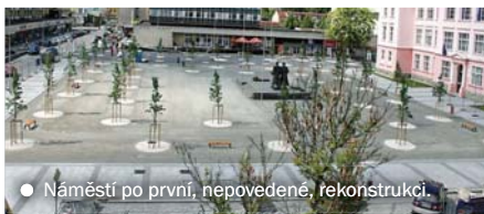
● Náměstí po první, nepovedené, rekonstrukci.

Ve Vsetíně nedávno otevřeli podruhé zrekonstruované náměstí Svobody – dlážděné, s trávničky, lavičkami, relaxační zónou i skákacím polem pro děti. O nápravu původně zpackané rekonstrukce se zasadili místní občané.