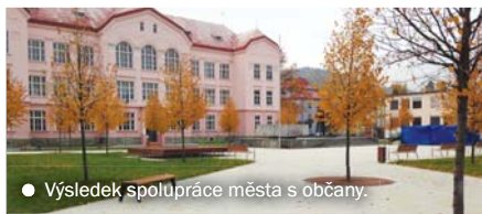
● Výsledek spolupráce města s občany.

P rvní rekonstrukce náměstí, ukončená v červnu roku 2011, nedopadla dobře. Mlatem pokrytá plocha bez zeleně v létě přášila a pálila, v zimě se nedala uklidit od sněhu, na jaře a na podzim byla plná bláta a stojící vody. Na neúrodném náměstí nebylo možné pořádat trhy, koncerty ani jiné společenské události, a náměstí se tak na čas vylidnilo.